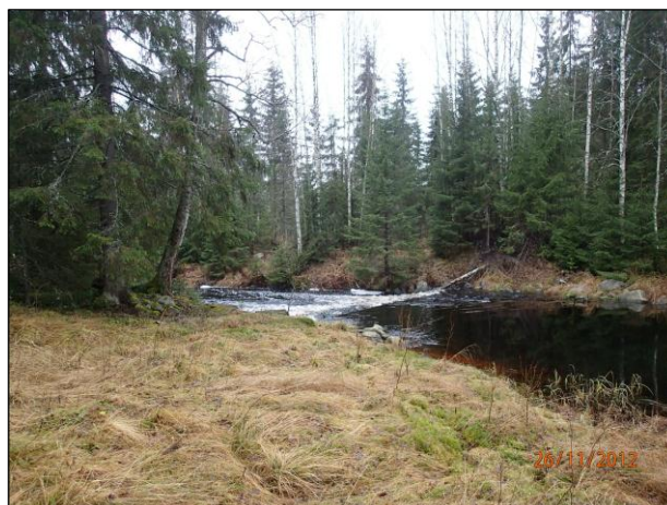
Leppäkosken suuta ja sen itäpuolista harjannetta